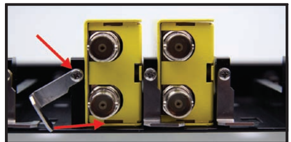
モジュールは所定の位置に確実にクランプ

ラックフレームの後ろに見える電源コネクタと外部電源ユニット (バックアップ電源としてもう一つ外部電源ユニットを接続できます)